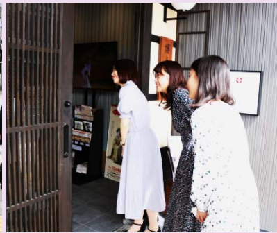
博多の総鎮守・櫛田神社 清道の目と鼻の先にある「博多伝統芸能館」