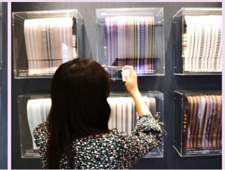
エントランスには、博多帯オブジェが！