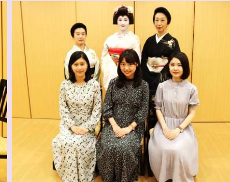
距離が近く一体感のある舞台と客席!! 演舞鑑賞やお座敷遊び体験をお楽しみください✿