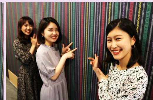
博多織を代表とする柄「博多献上」の廊下がお出迎え!!